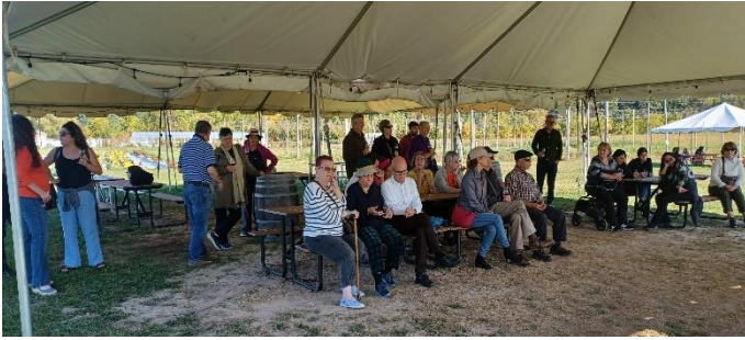
El grupo esperando ansioso entrar a las bodegas.