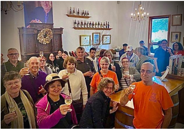
En la barra ya probando uno de los vinos