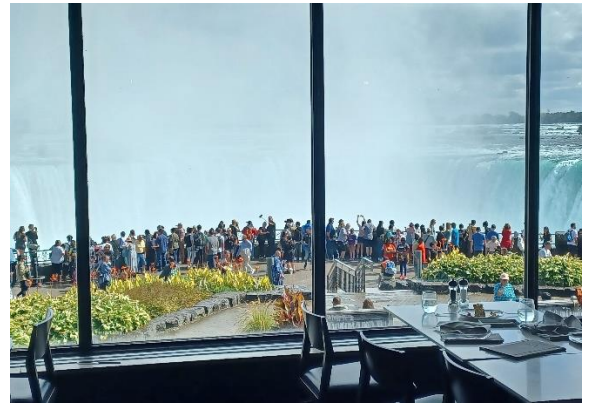
La vista de las cataratas desde nuestras mesas.