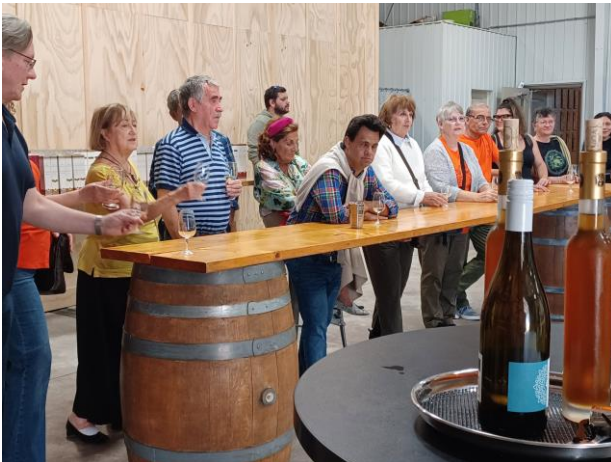
Un poco de educación sobre los vinos