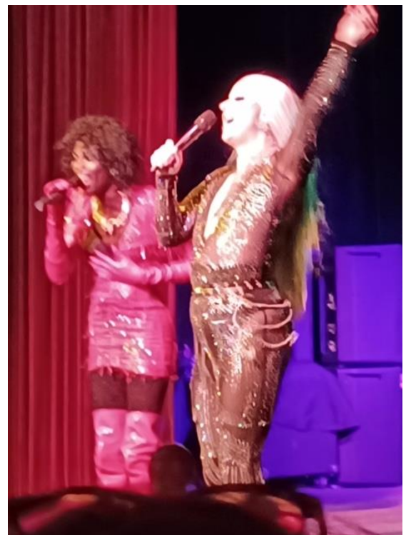
“Champagna” y “Naomi”