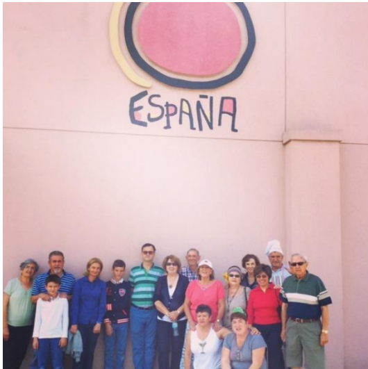
YARD SALE SET. 2014