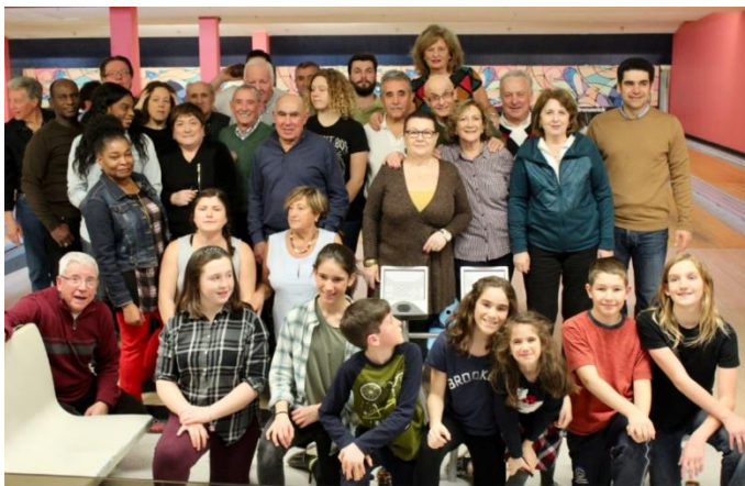
BOLOS, ABRIL 2016