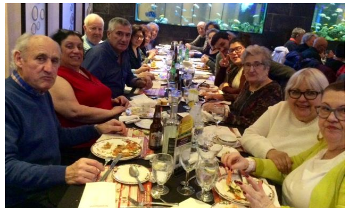
BOLOS , FEB. 2020