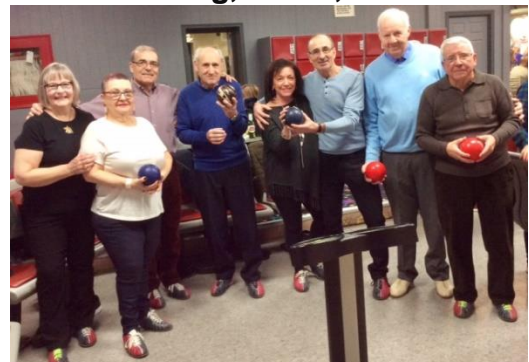
Bowling, febrero 16, 2020.