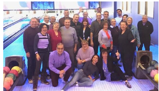
Bowling, abril 1, 2019.